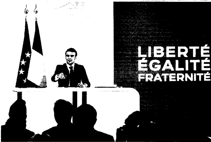
O presidente da França revelou que pretende vir ao Brasil no mês de março

Em meio aos protestos do setor agrícola, o presidente defendeu a aplicação de normas igualitárias para produtos de dentro e de fora da União Europeia