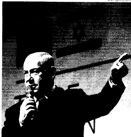
Israel tem apoio dos Estados Unidos frente a conflitos no Oriente Médio

A ação levou à criação de uma força-tarefa liderada pelos EUA, que conta com até seis destróieres, e levou a ataques diretos contra a porção que o grupo controla no Iêmen desde o início da guerra civil no país árabe, em 2014. O mais duro dos bombardeios foi feito há duas semanas por Israel, obliterando o porto de Hodeidah. Mas a ação conjunta proposta pelos houthis tem outra motivação: os assas sinatos do líder político do Hamas, Ismail Haniyeh, e do comandante do Hezbollah, Fuad Shukr, ocorreram no espaço de algumas horas na semana passada. Enquanto Shukr foi alvo de um ataque por Israel, num ato que assumido em Beirut, o governo de Binyamin Netanyahu não assumiu diretamente a morte de Haniyeh, que dormia como convidado de honra da posse do novo presidente iraniense.