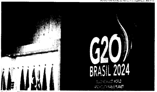
Embora o G20 se proponha a buscar consensos, o fórum enfrenta desafios significativos

Neste ano, sob a presidência rotativa do Brasil, a agenda prioriza a discussão sobre medidas de inclusão social e econômica, sustentabilidade ambiental e o fortalecimento da governança global. Um dos principais temas será a reforma de instituições financeiras internacionais, como o FMI e o Banco Mundial, para dar mais voz a economias emergentes e adaptar essas organizações às realidades do século XXI.