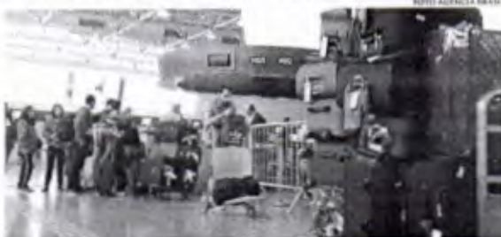
O ministro da Fazenda, Fernando Haddad, disse que a situação preocupa o governo federal

Por ser apresentado antes, o indicador sinaliza uma tendência para os preços no IPCA (Índice Nacional de Preços ao Consumidor Amplo), também calculado pelo IBGE. Mas não foram apenas os consumidores que reclamaram. De outro lado, as companhias aéreas disseram que houve aumento nos custos de operação no país, que evoluiu, por exemplo, depois com o aumento de aviação e juros. A variação das passagens aéreas em 2023 (48,11%) foi a segunda maior entre os 367 subítemas (bens e serviços) que compõem o