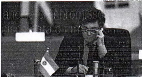
Milei compartilhou divulgação da criptomoneda que se dizia para ajudar pequenos e médios empreendedores

Parlamentar se refere ao escândalo da criptomoneda que jogou um balde de água fria no bom momento econômico do governo ultraliberal