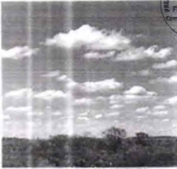
As condições de seca podem trazer riscos à saúde e de baixa umidade

A Fundação Cearense de Meteorologia e Recursos Hídricos (Funceme) informou que a seca de agosto vem sendo uma área de baixa umidade relativa do ar no Ceará, principal fator de risco de saúde, em regiões como as regiões do interior, especialmente em áreas de baixa umidade, que costumam apresentar valores abaixo de 40% no período das tardes. De acordo com o órgão, a baixa umidade do ar pode causar irritação das vias respiratórias, agravando problemas de saúde, como a asma, além de facilitar a transmissão de doenças respiratórias. As crianças são a população mais afetada e os sintomas de baixa umidade do ar são: resaca nasal, tosse seca e irritação da pele.