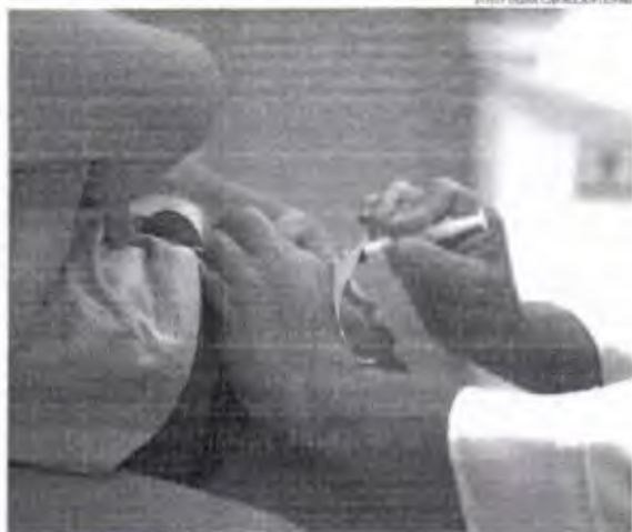
O período chuvoso é propício para o aumento de casos de síndromes gripais