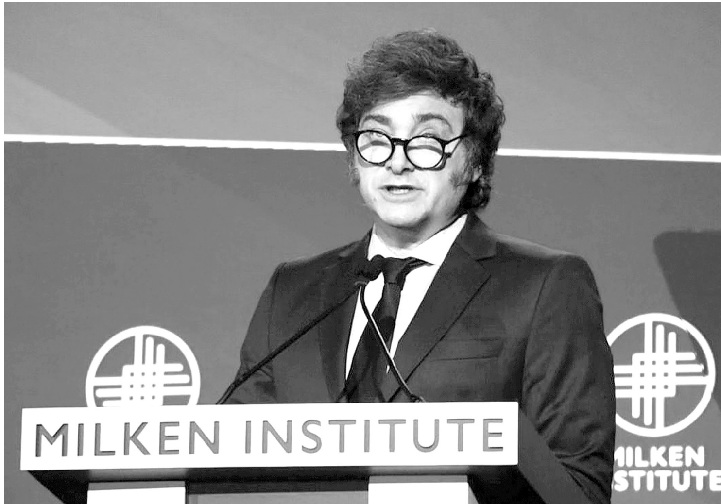
O projeto defendido pelo presidente visa a promoção de uma série de reformas na administração pública

O governo de Javier Milei enfrentou, nesta quinta-feira, 09, a segunda greve geral na Argentina em um período de cinco meses. Mais de 700 voos que partiriam ou chegariam de aeroportos argentinos foram cancelados, uma vez que pilotos e trabalhadores aeronáuticos aderiram ao movimento. 55 mil passageiros foram afetados pela situação, conforme informações da administradora Aeropuertos Argentina 2000.