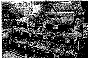
Entre os itens que contribuíram para o aumento da cesta estão o feijão, o pão francês, a farinha de mandioca e o óleo de soja

A maior alta foi registrada no Rio de Janeiro, onde o preço médio da cesta subiu 7,65%, seguida por Curitiba (7,46%), São Paulo (6,36%) e Campo Grande (5,51%). Já a menor variação foi registrada em Salvador (1,46%). Em Fortaleza, o valor da cesta básica aumentou 4,17% em março e alcançando valor médio de R$ 635,02. O resultado é o mais alto