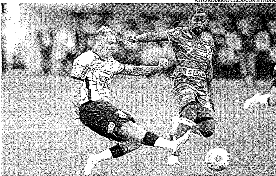
Próximo compromisso do Corinthians será contra Atlético-MG, já o Fortaleza receberá em casa o São Paulo

Diante de 36.059 pagantes, o Corinthians contou com gol do volante Cantillo, aos 41 minutos do segundo tempo, para vencer o Fortaleza por 1 a 0 neste sábado (6). A partida na Arena Corinthians foi válida pela 30ª rodada do Campeonato Brasileiro. Com o resultado, a equipe paulista chega aos 47 pontos, um atrás do Fortaleza, que segue em quinto lugar do Nacional. Depois de uma vitória sua sobre a lanterna Chapecoense por 1 a 0 na segunda (1º), o time alvinegro se encontrou novamente com uma arena praticamente lotada, mas não fez boa atuação e deixou o torcedor na bronca com Syrylho na maior parte do jogo. Entre as principais na etapa inicial, a principal foi a dificuldade de superar a marcação do Fortaleza no meio de campo, enquanto Renato Augusto, com capacidade para organizar o setor, foi deslocado para o ataque. Já o técnico argentino Juan Pablo Vojvoda não pode contar com cinco atletas, sendo três suspensos (Titi, Jussa e Ederson, emprestados ao Fortaleza pelo Corinthians) e os machucados Lucas Crispim e Yago Pikachu. O atacante Davíd, com dores, foi substituído