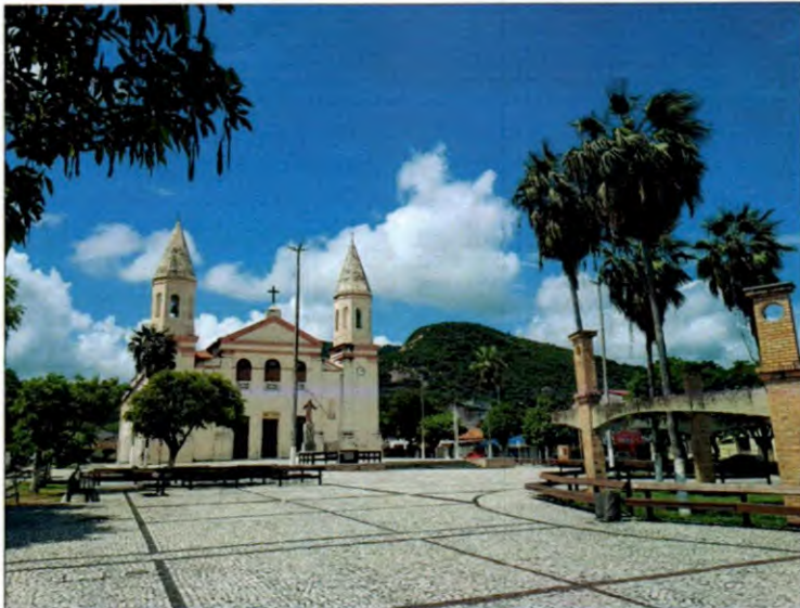
com Catedral de Nossa Senhora das Mercês ao fundo