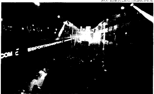
A edição de 2024 da festa ocorrerá novamente no bairro Manoel Dias Branco

Em uma transmissão ao vivo nesta quarta-feira, 22, o governador do Ceará, Elmano Freitas, anunciou que o Fortal não acontecerá mais no terreno próximo ao Aeroporto de Fortaleza, conforme havia sido informado pela organização do evento no final de abril. "Superamos as dificuldades que tínhamos até aqui e tenho certeza que o Fortal deste ano será mais bonito, mais alegre e mais festivo", comemorou o gestor estadual, citando as polêmicas envolvendo a mudança do espaço da festa.