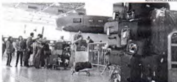
O ministro da Fazenda, Fernando Haddad, disse que a situação preocupa o governo federal

Por ser apresentado antes, o indicador sinaliza uma tendência para os preços no IPCA (Índice Nacional de Preços ao Consumidor Amplo), também calculado pelo IBGE. Mas não foram apenas os consumidores que reclamaram. Do outro lado, as companhias aéreas disseram que houve aumento nos custos de operação no país, que envolvem, por exemplo, despesas com querosene de aviação e juros. A variação das passagens aéreas em 2023 (48,11%) foi a segunda maior entre os 367 subítem (bens e serviços) que compõem o